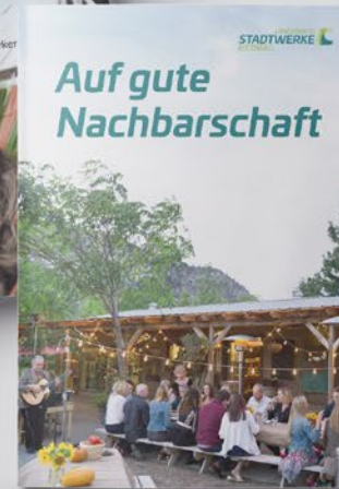
Imagebroschüre Stadtwerke Rietberg Langenberg