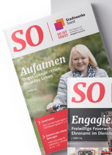
Kundenmagazin Stadtwerke Soest