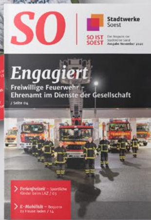
Kundenmagazin Stadtwerke Soest