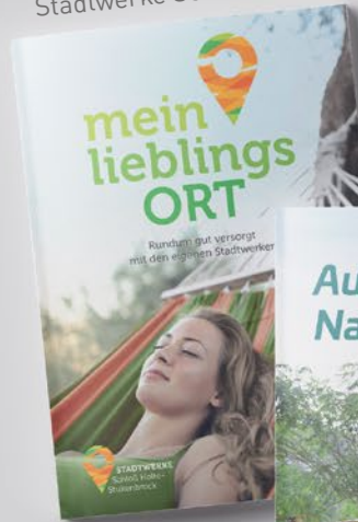
Imagebroschüre Stadtwerke Schloß-Holte Stukenbrock