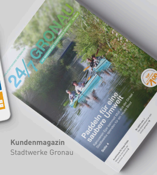
Kundenmagazin Stadtwerke Gronau