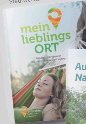
Imagebroschüre Stadtwerke Schloß-Holte Stukenbrock