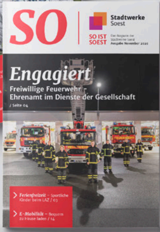
Kundenmagazin Stadtwerke Soest