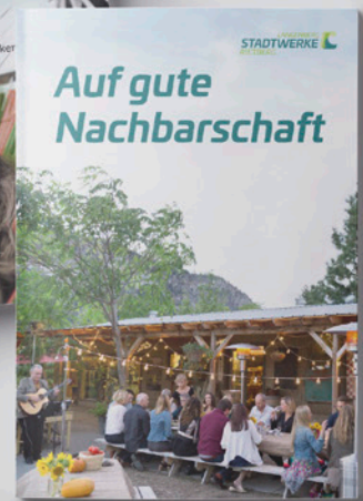
Imagebroschüre Stadtwerke Rietberg Langenberg