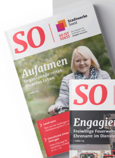
Kundenmagazin Stadtwerke Soest